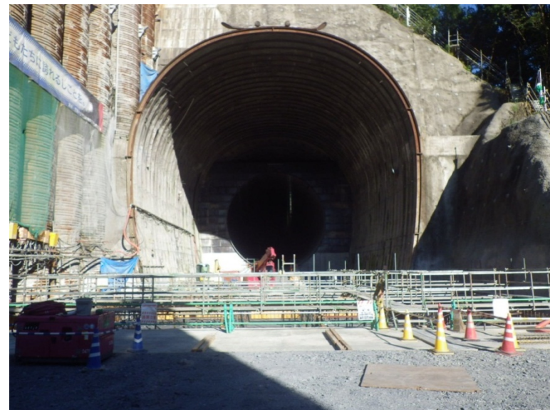
8月24日 ゲート室部底盤コンクリート打設、アーチ部鉄筋組立