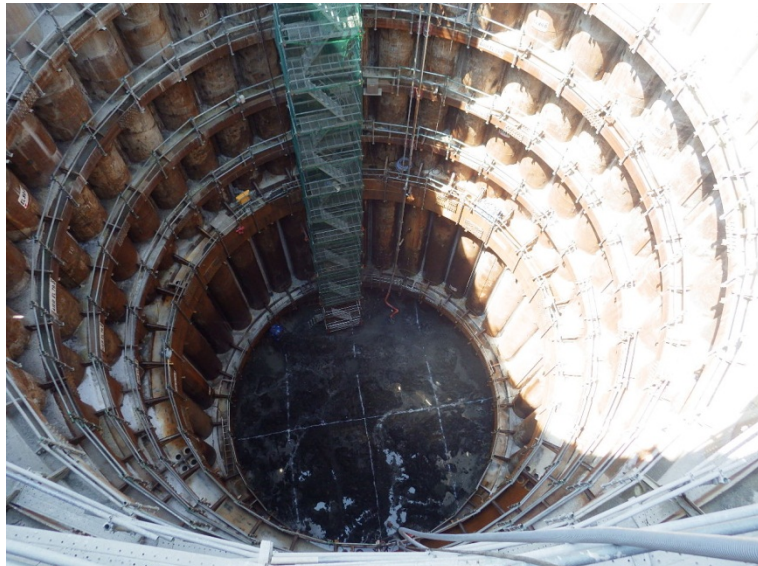
8月17日 立坑掘削、接続部カーテンチェック孔