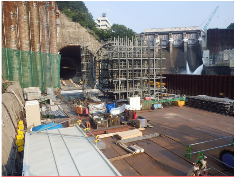
8月3日 鉄筋・型枠組立、インバートコンクリート打設準備

8月 鉄筋・型枠組立、インバートコンクリート打設、ゲート室部底盤コンクリート打設、アーチ部鉄筋組立