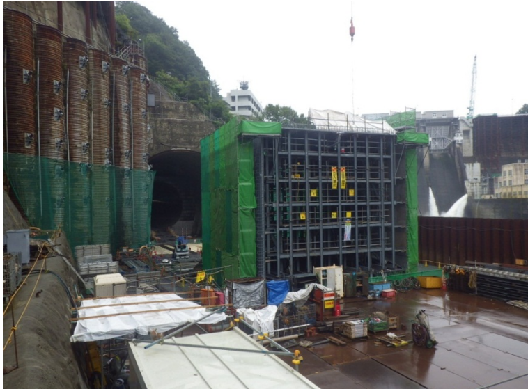
8月31日 仮設盛土撤去、アーチ部鉄筋組立