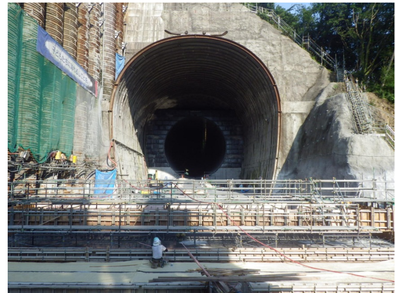
8月10日 鉄筋・型枠組立、インバートコンクリート打設