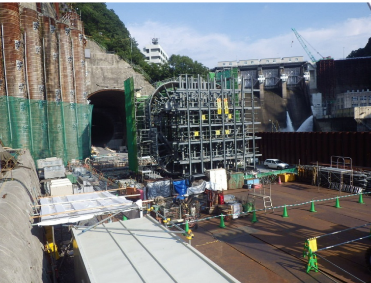
8月17日 鉄筋・型枠組立、インバートコンクリート打設