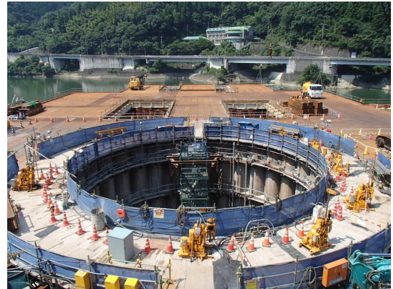
8月10日 立坑掘削、接続部カーテンチェック孔