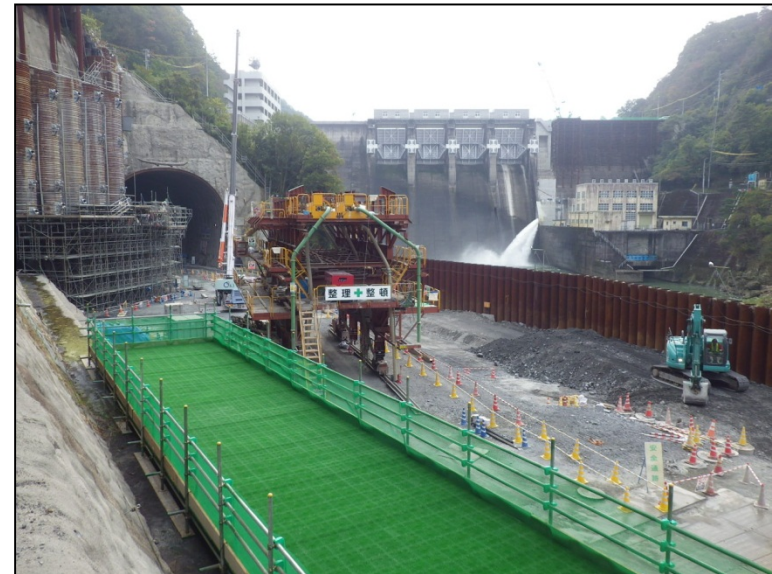
11月10日 深礎アンカー工足場解体