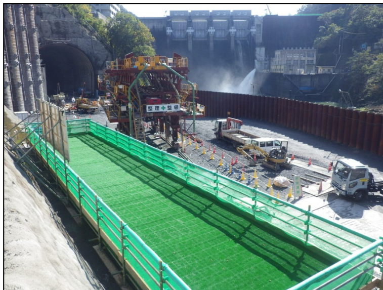
11月17日 調査ボーリング、ファイアーロックボルト工