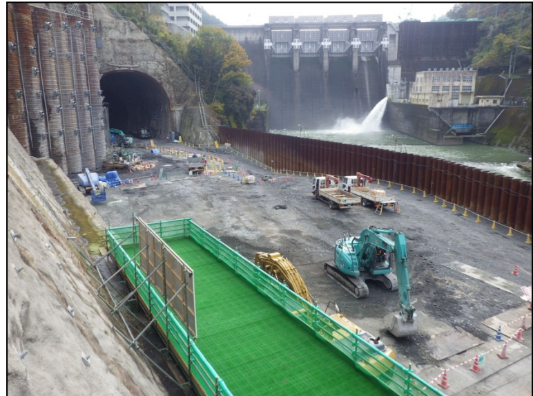
11月25日 調査ボーリング