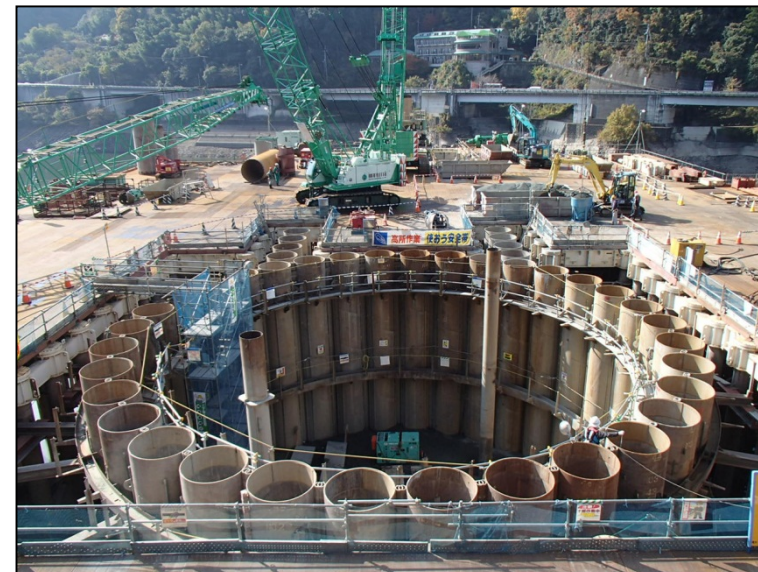
11月25日 鋼管矢板部掘削、仮設構台支持杭引き抜き