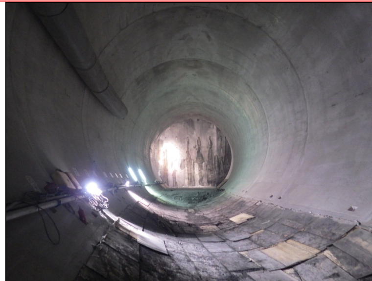
11月10日 仮設盛土撤去