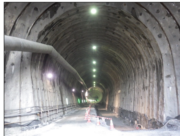
11月25日 仮設盛土撤去(水圧鉄管設置部)