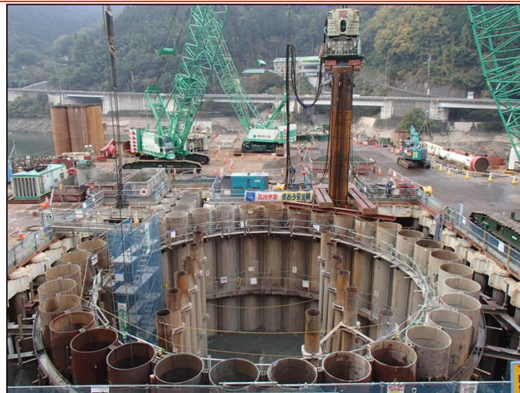
11月10日 鋼管矢板部掘削、鋼管矢板打込み