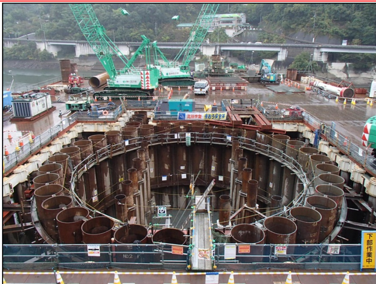
11月4日 鋼管矢板部掘削、鋼管矢板打込み