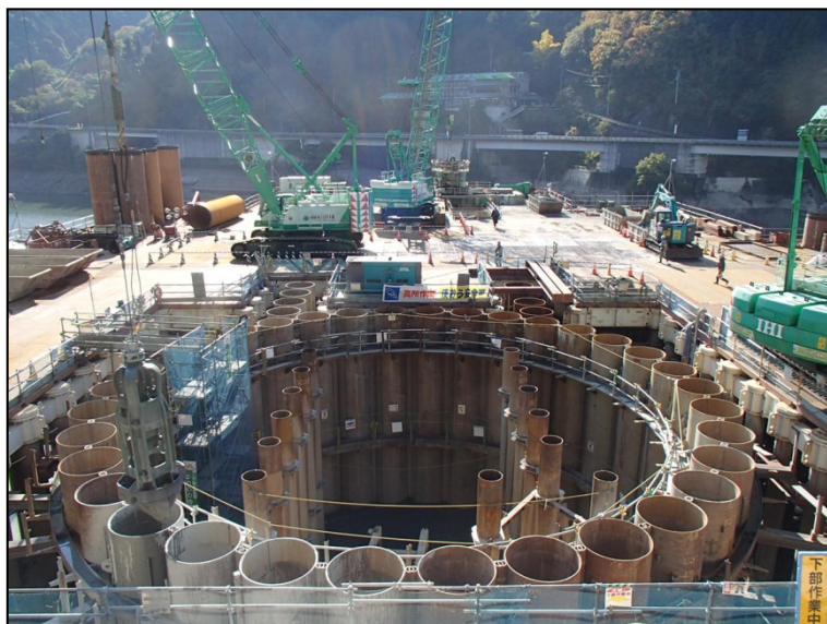
11月17日 鋼管矢板部掘削、鋼管矢板打込み