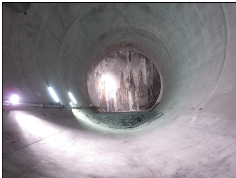
11月17日 仮設盛土撤去