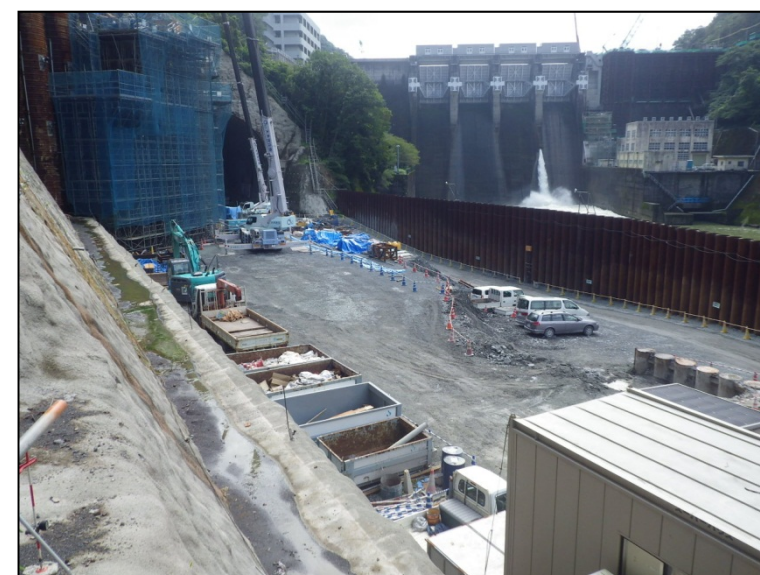
9月22日 深礎アンカー工