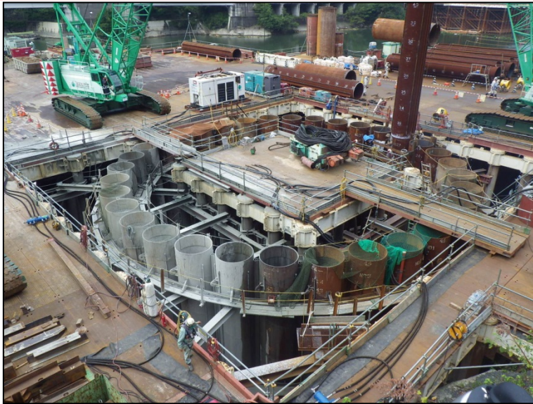
9月29日 流入水路掘削、鋼管矢板打込み