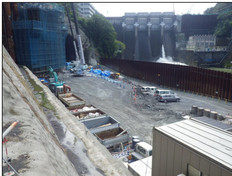
9月16日 深礎アンカー工