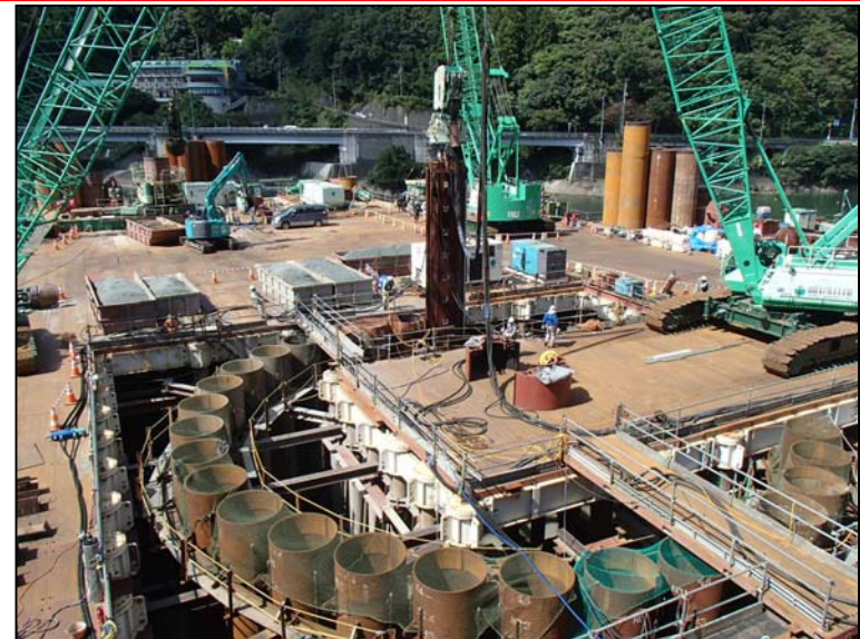
9月8日 流入水路掘削、鋼管矢板打込み