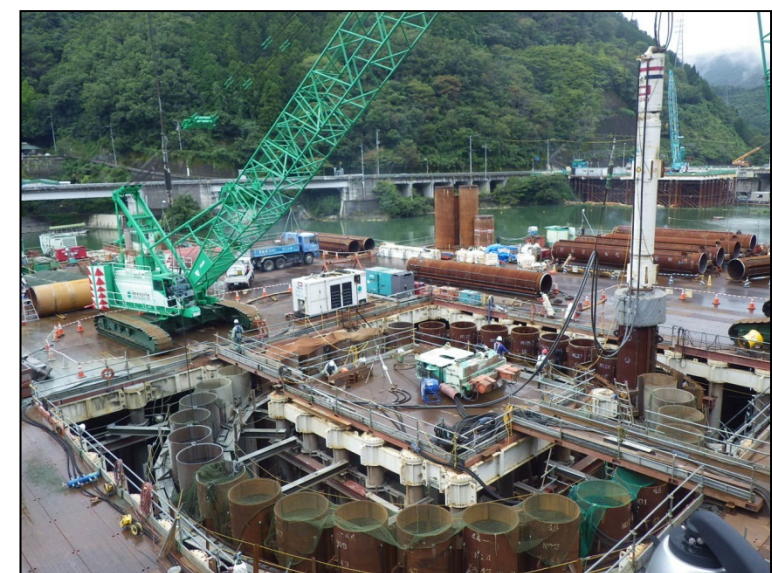
9月22日 流入水路掘削、鋼管矢板打込み