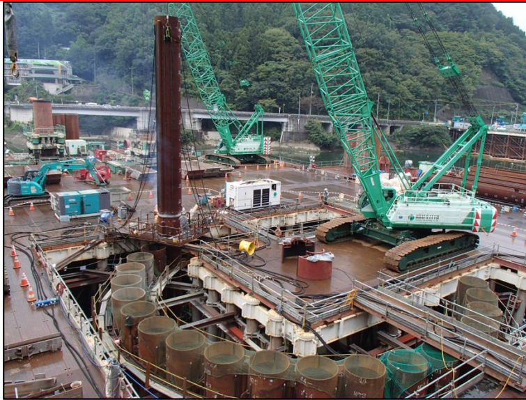
9月1日 流入水路掘削、鋼管矢板打込み