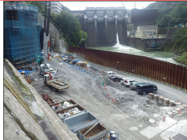
9月8日 深礎アンカー工