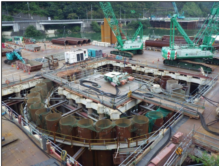
9月16日 流入水路掘削、鋼管矢板打込み