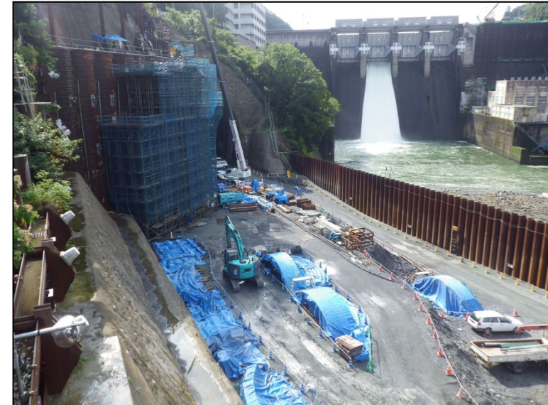
8月25日 深礎アンカー工