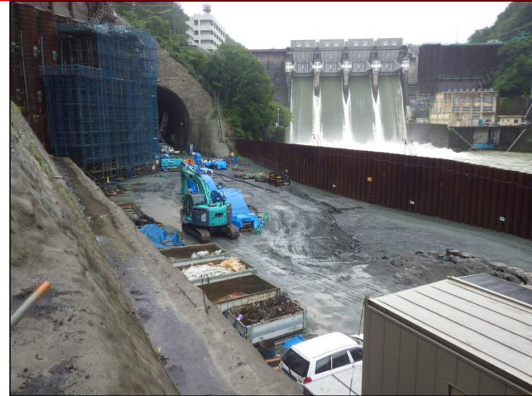
8月11日 深礎アンカー工