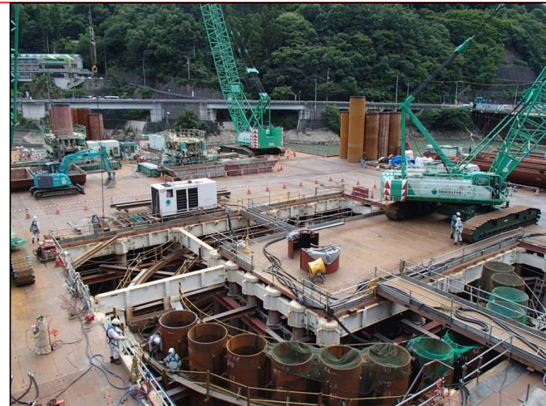
8月11日 流入水路掘削、鋼管矢板打込み