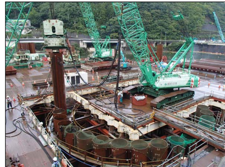
8月25日 流入水路掘削、鋼管矢板打込み