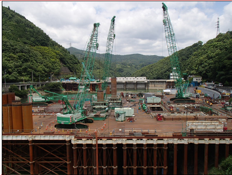
7月7日 流入水路掘削、鋼管矢板打込み準備