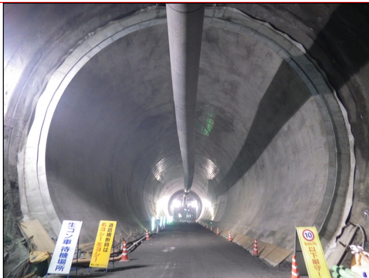
7月7日 インバート工、覆工