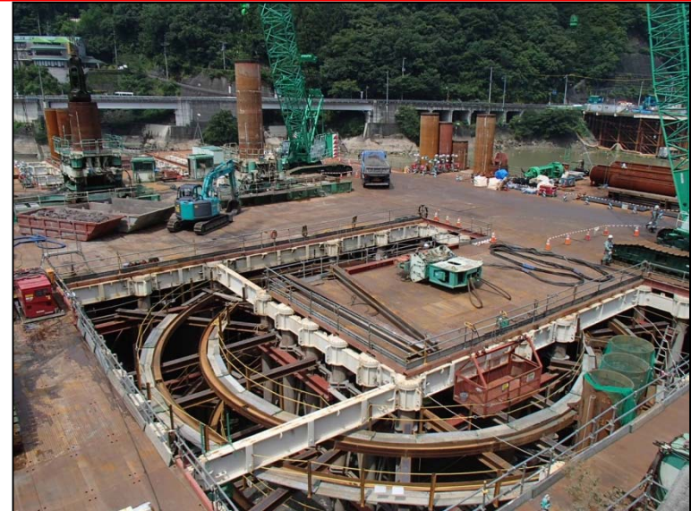
7月14日 流入水路掘削、鋼管矢板打込み準備