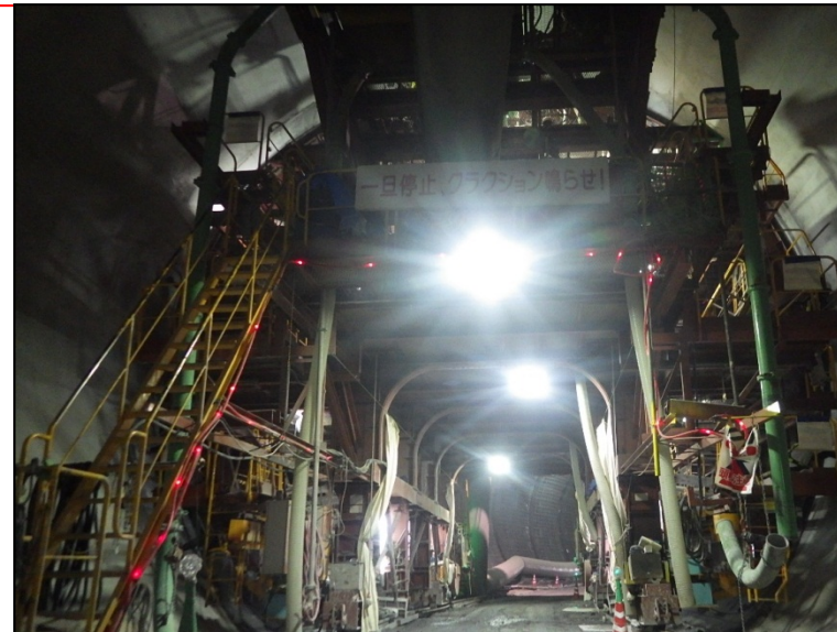
7月14日 インバート工、覆工