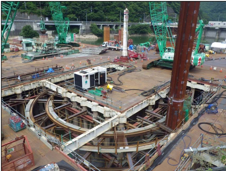
7月22日 流入水路掘削、鋼管矢板打込み