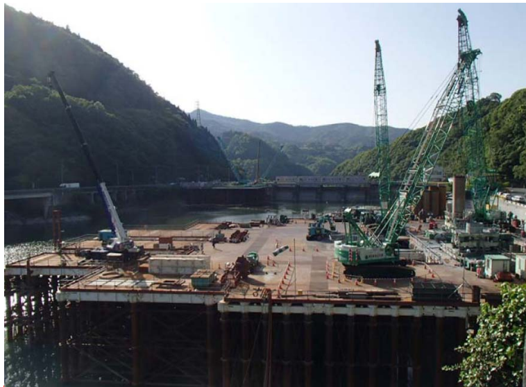
5月19日 呑口立坑掘削、仮設構台設置完了