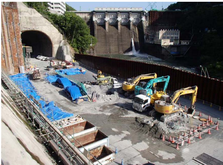
5月19日 トンネル工準備作業