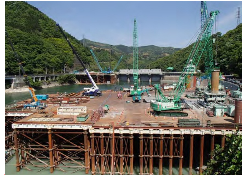
5月12日 仮設構台設置、呑口立坑掘削