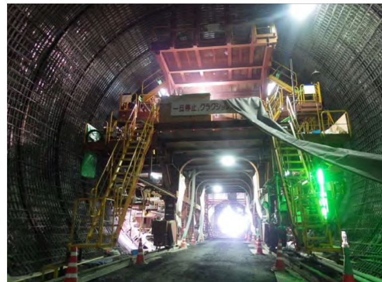
5月12日 インバート工、覆工