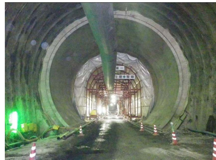
5月26日 インバート工、覆工