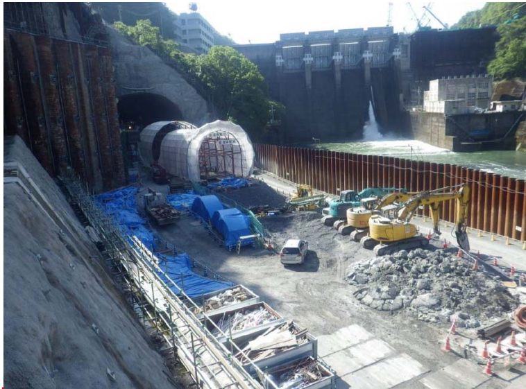
5月7日 トンネル工準備作業