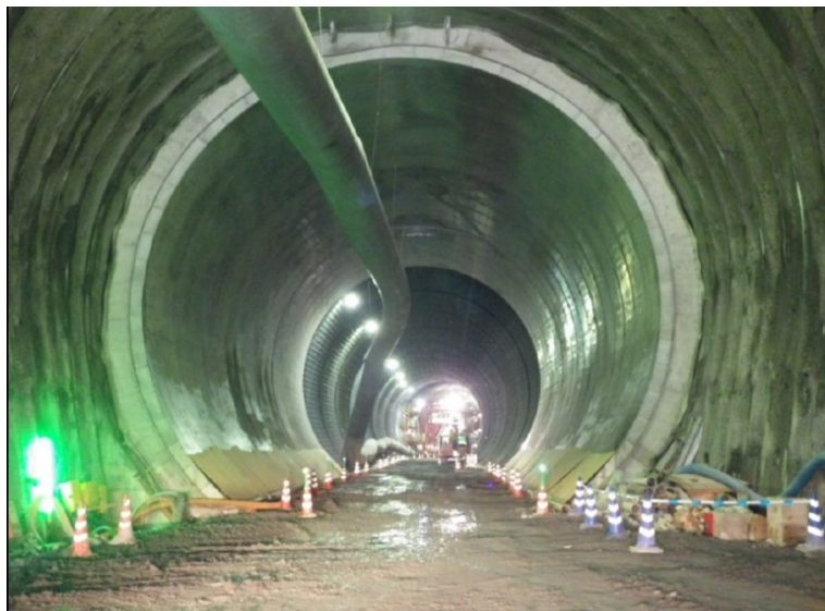
5月7日 インバート工、覆工