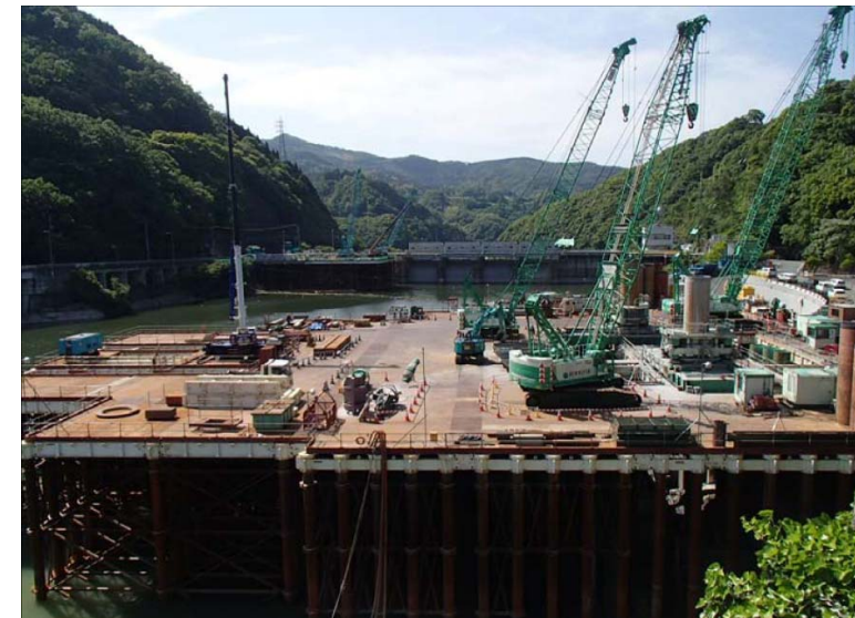
5月26日 呑口立坑掘削