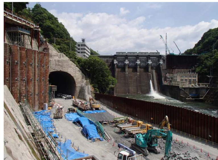
5月26日 トンネル工準備作業