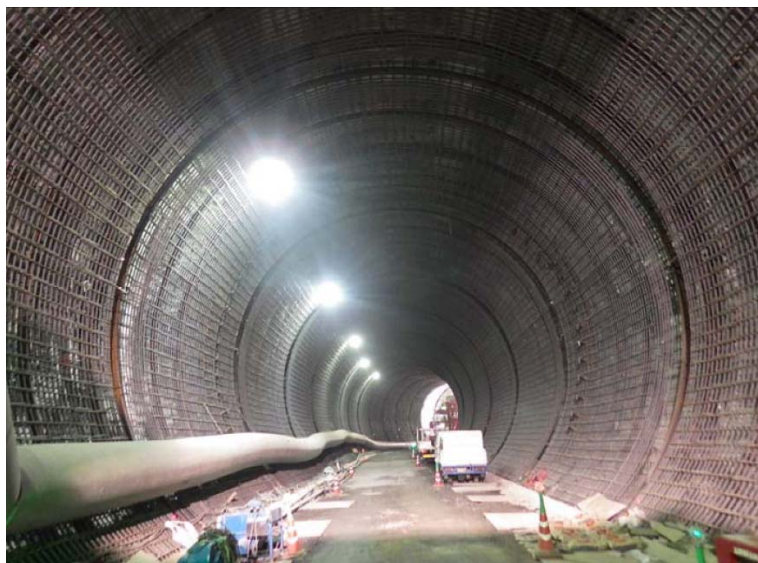
5月19日 インバート工、覆工