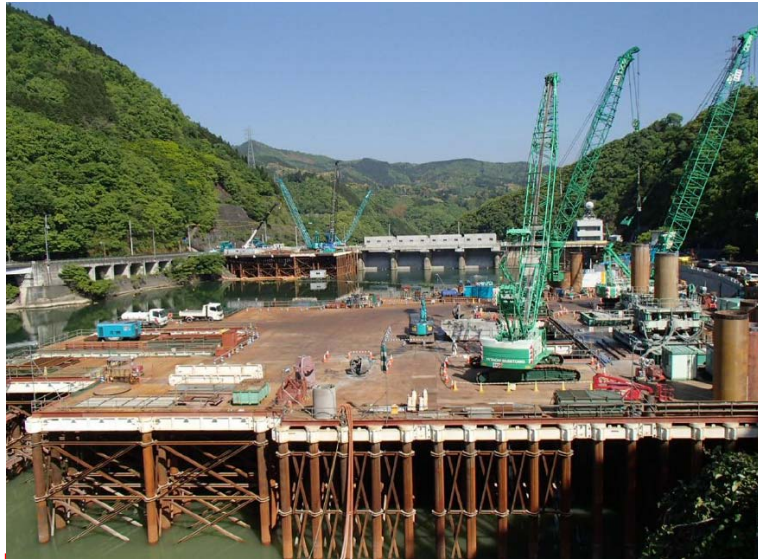
5月7日 呑口立坑掘削