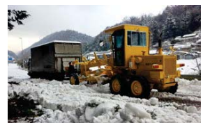
立ち往生車両の移動