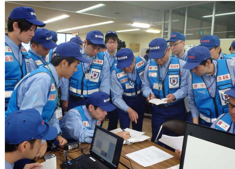
活動状況報告、情報収集