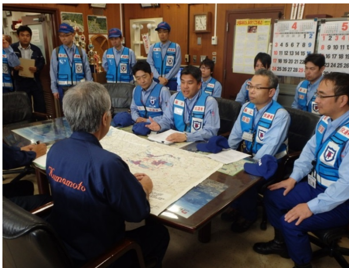
調査内容を熊本県へ説明