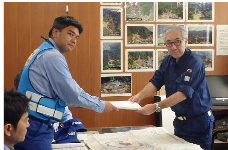
熊本県坂井土木部長へ中間結果書手渡し