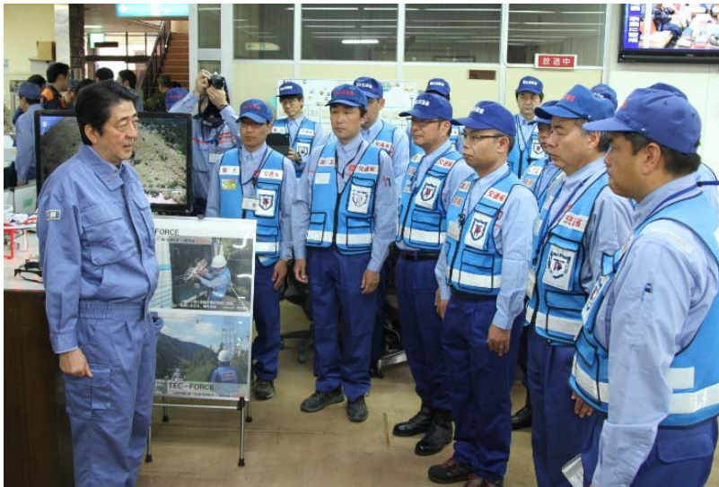
安倍総理大臣がTEC-FORCE隊を激励 ◇場所：熊本県阿蘇地域振興局