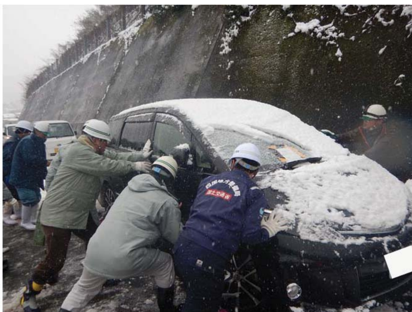
車両簡易移動器具を用いた車両移動の様子