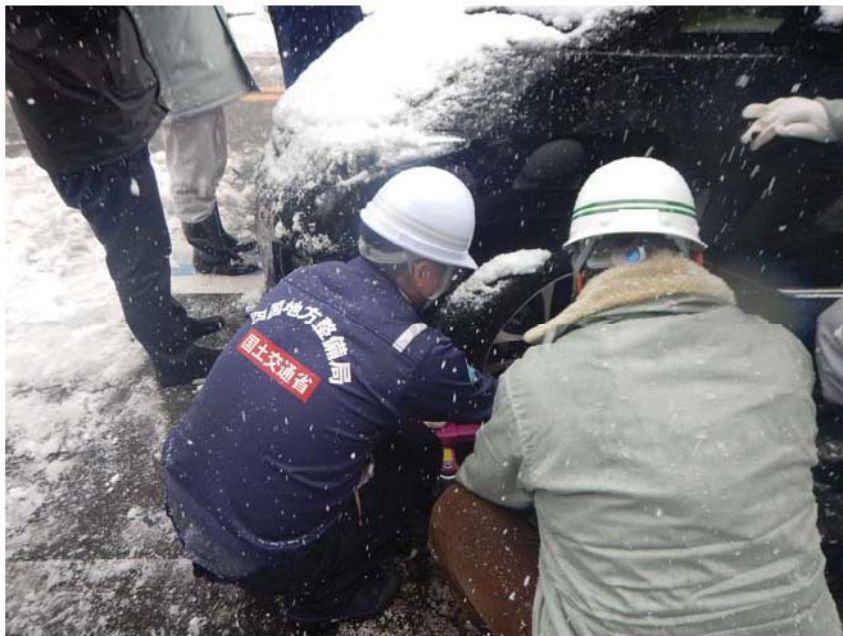
車両簡易移動器具の利用方法を指導