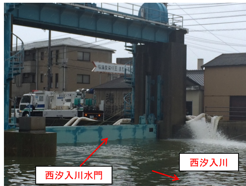
排水ポンプ車による排水状況(H26 台風11号)