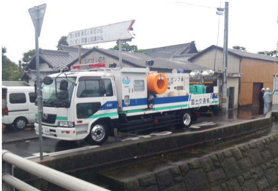
排水ポンプ車(30m 3 /min級)