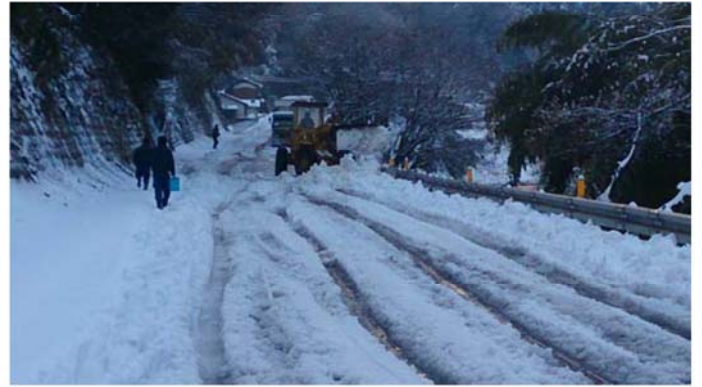
徒歩による状況確認（徳島県三好市池田町）