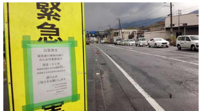
立て看板による災害対策法指定区間の周知 （愛媛県四国中央市上分町）