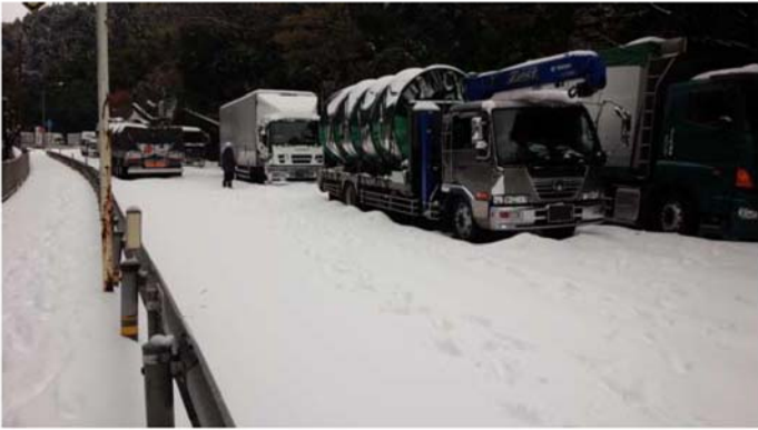
スタック状況（愛媛県四国中央市川滝町）