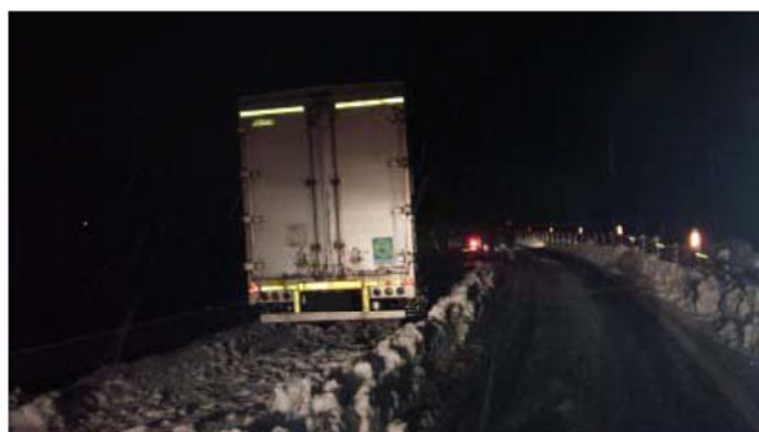
片側車線を塞いで放置された状況（徳島県三好市池田町）