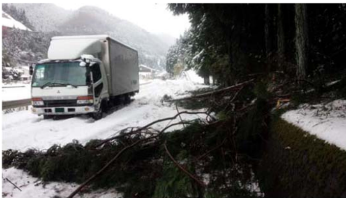
スタック車両と積雪による倒木 （徳島県三好市池田町）