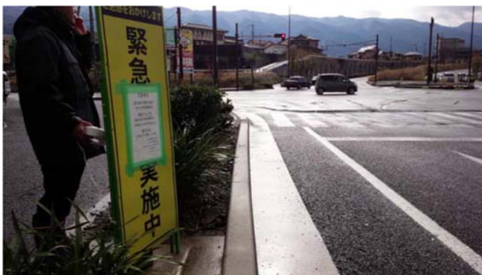
立て看板による災害対策法指定区間の周知 （愛媛県四国中央市上分町）