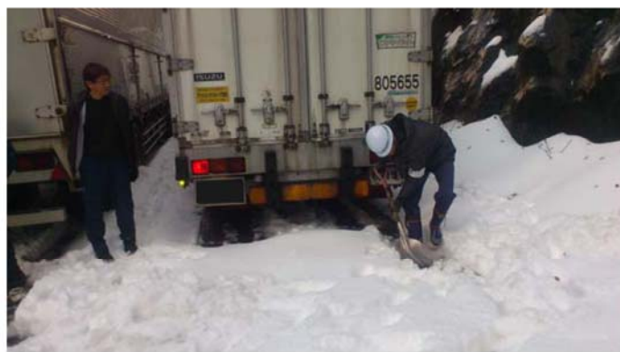
職員によるスタック車両の移動支援（愛媛県四国中央市川滝町）