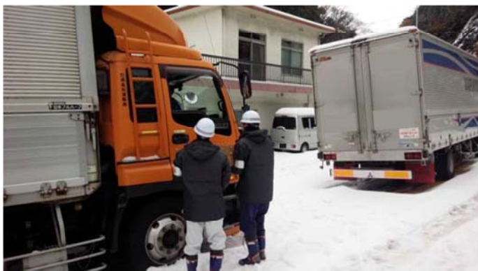
スタック車両1台毎の安否確認 (愛媛県四国中央市川滝町)