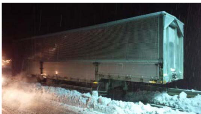
道路に放置されたトレーラ（徳島県三好市池田町）