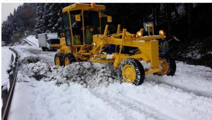
グレーダーによる除雪状況 (徳島県三好市池田町)