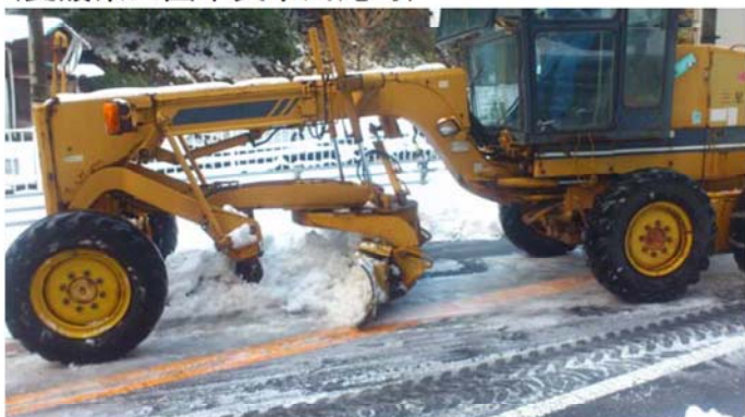
グレーダーによる除雪状況 (愛媛県四国中央市川滝町)