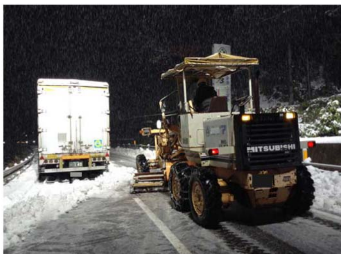
グレーダーによる除雪状況 (徳島県三好市池田町)