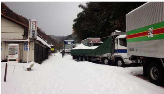
スタック状況（愛媛県四国中央市川滝町）