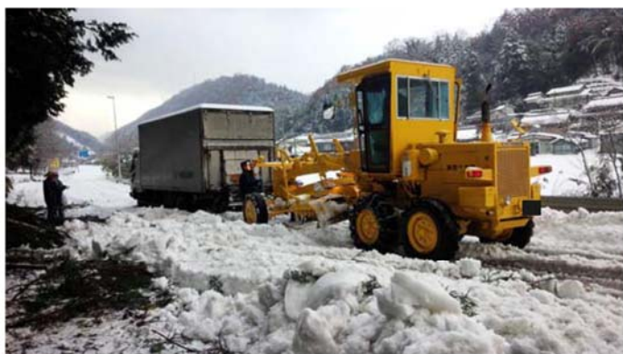
スタック車両の移動（徳島県三好市池田町）