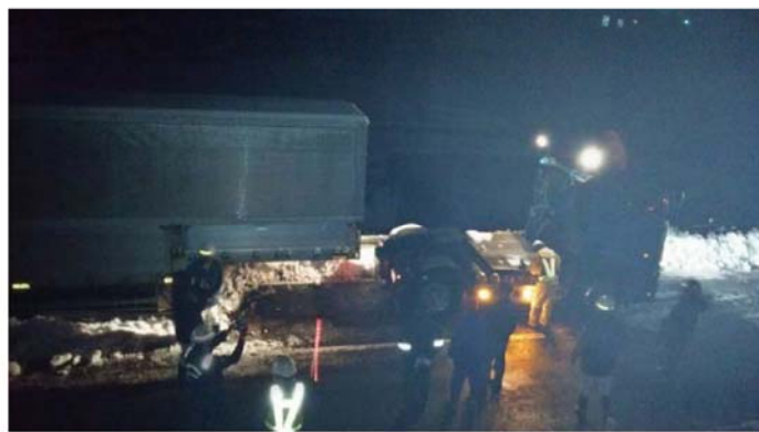
トラクタ連結作業（道路管理者） （徳島県三好市池田町）