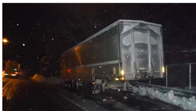
災害対策基本法に基づく撤去・移動 （拡幅部へ移動完了） （徳島県三好市池田町）