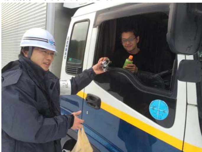
ドライバーへのおにぎりとお茶の提供 (愛媛県四国中央市川滝町)