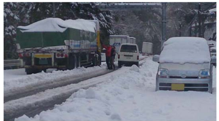
スタック状況（徳島県三好市池田町）