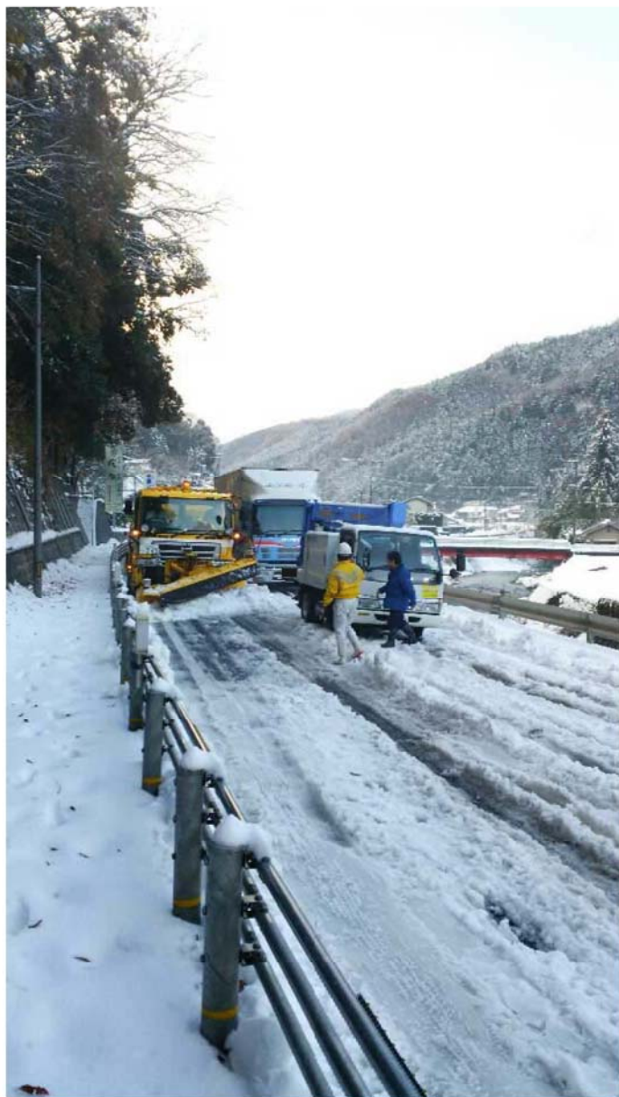
除雪車による除雪状況 (徳島県三好市池田町)