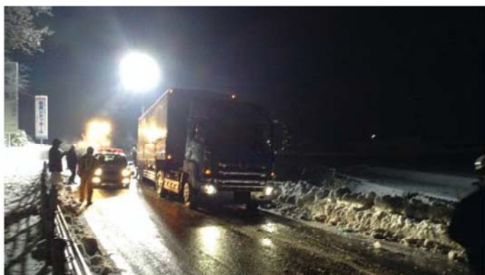
災害対策基本法に基づく撤去・移動（移動状況） （徳島県三好市池田町）