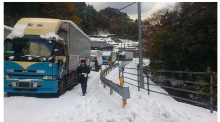
スタック状況の確認（愛媛県四国中央市川滝町）