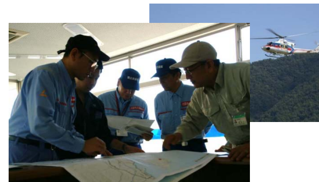
〔砂防班〕国総研、四国地整、福井県で打合せ