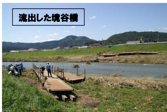
〔道路班〕被災状況調査