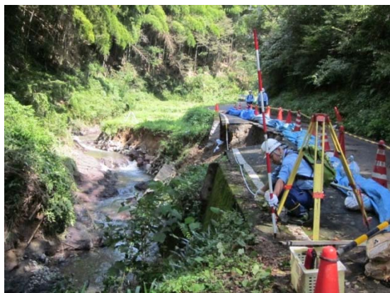
〔河川班〕被災状況調査