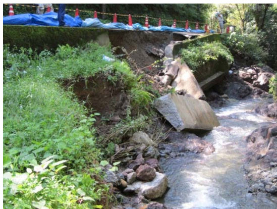
〔河川班〕被災状況調査