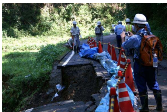
〔道路班〕被災状況調査