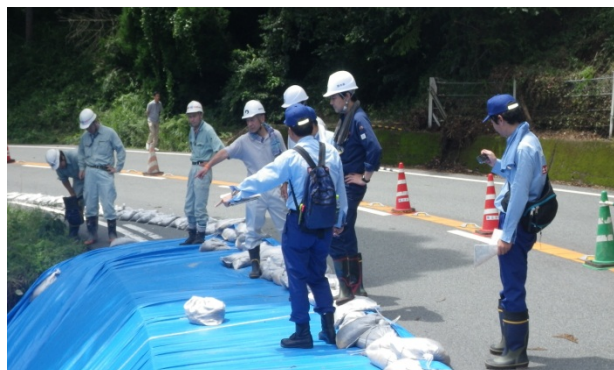
道路法面崩壊箇所応急復旧方法の技術的支援実施