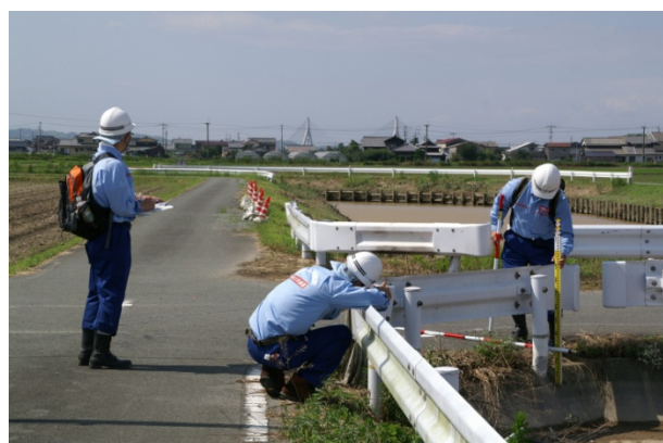
炎天下での痕跡調査