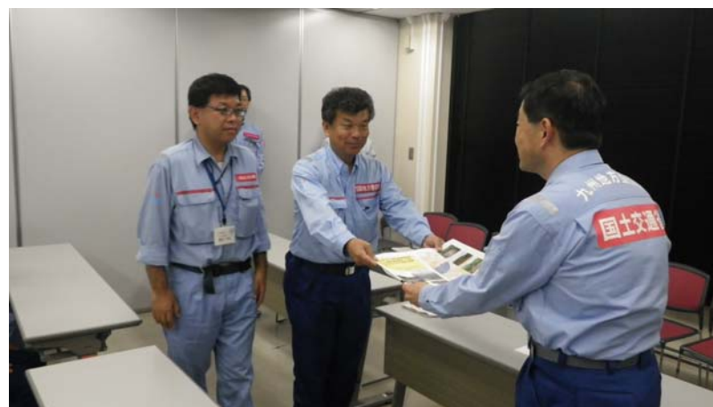
九州地方整備局へ土砂災害発生箇所状況報告