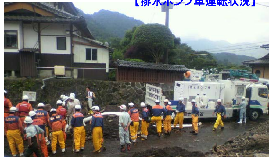
【排水ポンプ車運転状況】