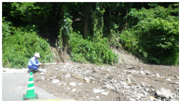
道路法面崩壊箇所の土砂流出状況