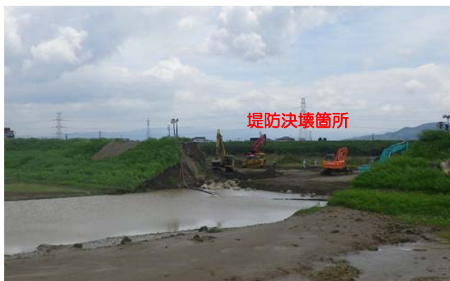
矢部川堤防決壊地点（矢部川右岸7k300）