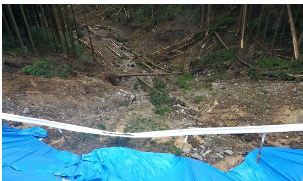
道路法面崩壊下斜面の被災状況