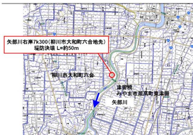
矢部川堤防決壊地点 (矢部川右岸7k300)