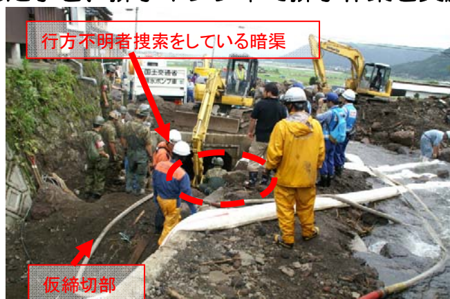
暗渠部の土砂撤去作業