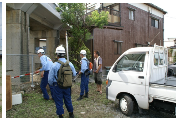
現地の方に痕跡ヒアリング