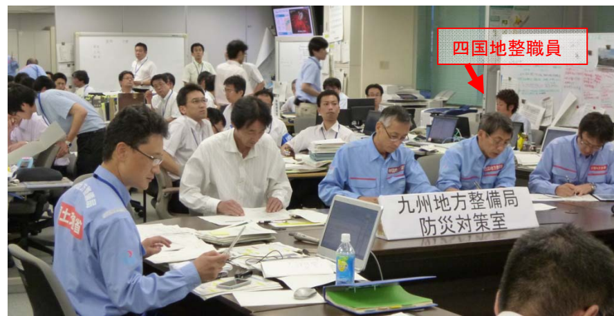
本部会議に出席し、四国地整テックフォースの状況を報告