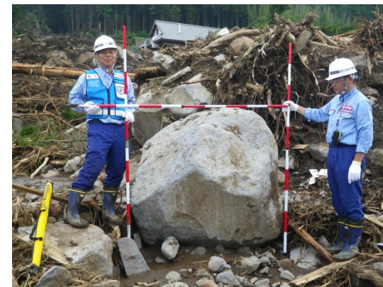
土砂災害被災状況調査