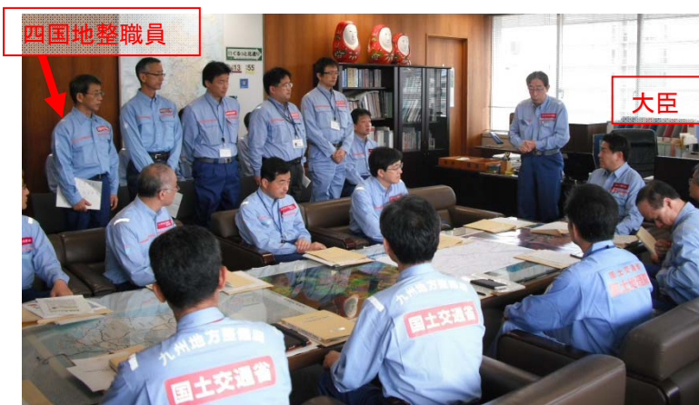
羽田大臣への説明に出席