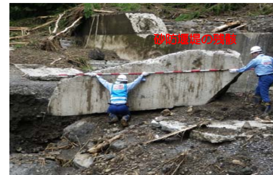
熊本県阿蘇市一の宮坂梨箇所