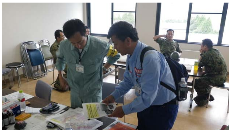
阿蘇市リエゾンとの打ち合わせ状況