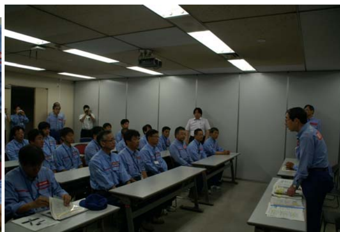
九州地整局長への報告書提出