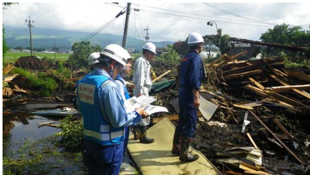
土砂災害被災状況視察