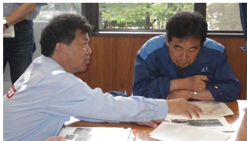
阿蘇市長へ土砂災害発生箇所状況報告