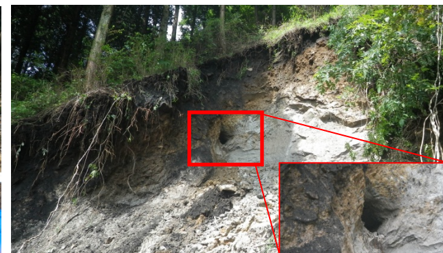
道路法面崩壊箇所上にできたパイピング現象