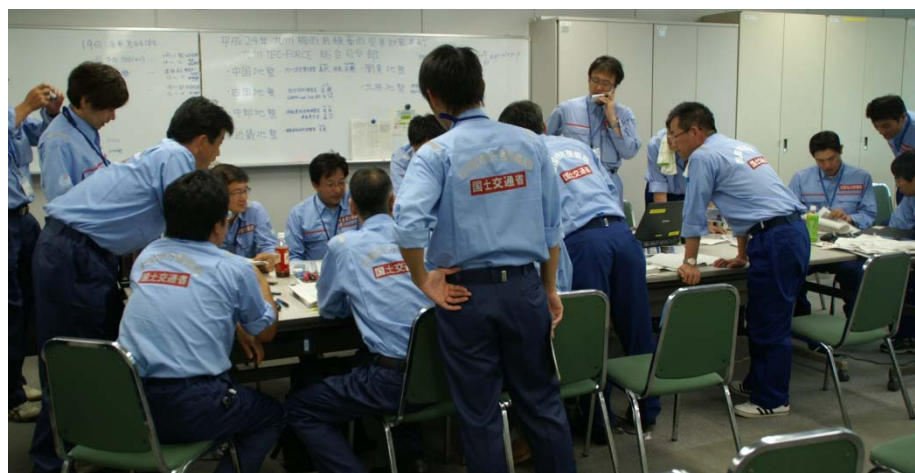
司令部ミーティング