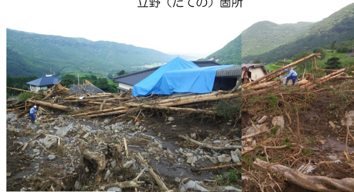
土砂災害被災状況調査