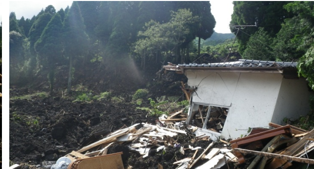
土砂災害被災状況視察