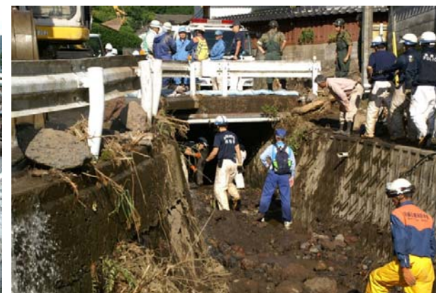
下流側から見た暗渠部