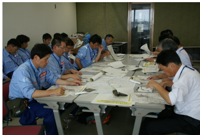
九州地整河川部への報告会