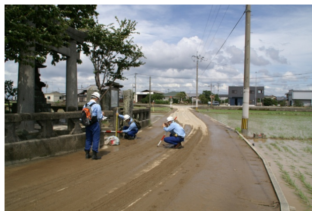
浸水痕跡の現地踏査状況