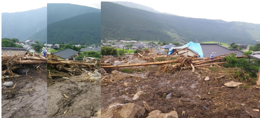
土砂災害被災状況調査