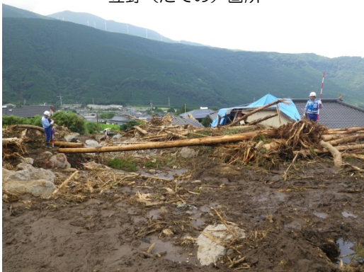
土砂災害被災状況調査