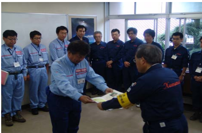
熊本県阿蘇地域振興局へ土砂災害発生箇所状況報告