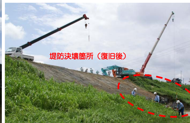
堤防決壊箇所での痕跡調査