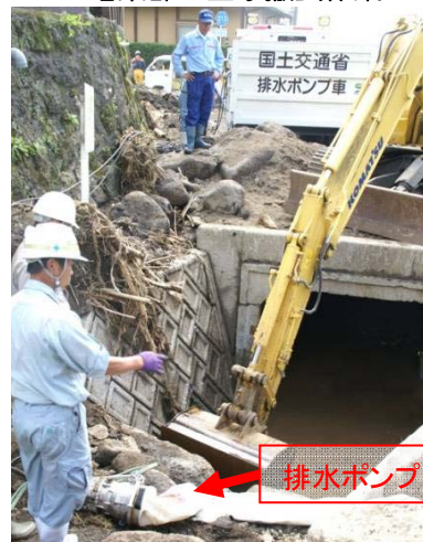
排水ポンプの再設置作業