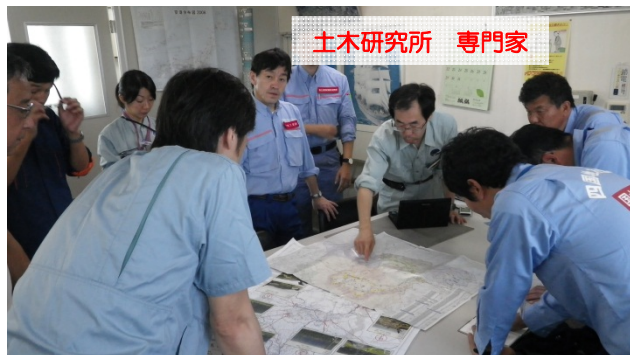
熊本空港（熊本港湾・空港整備事務所熊本空港分室）