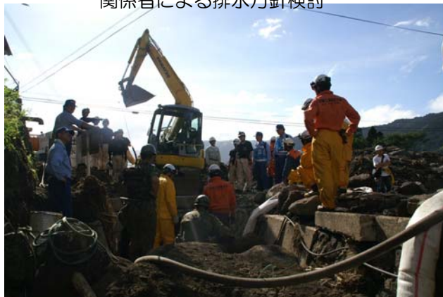
阿蘇市三野(さんの)地先の排水箇所