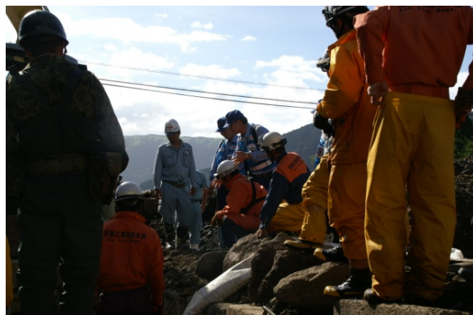
関係機関との対応方針の検討