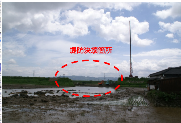
矢部川堤防決壊地点 (矢部川右岸7k300)