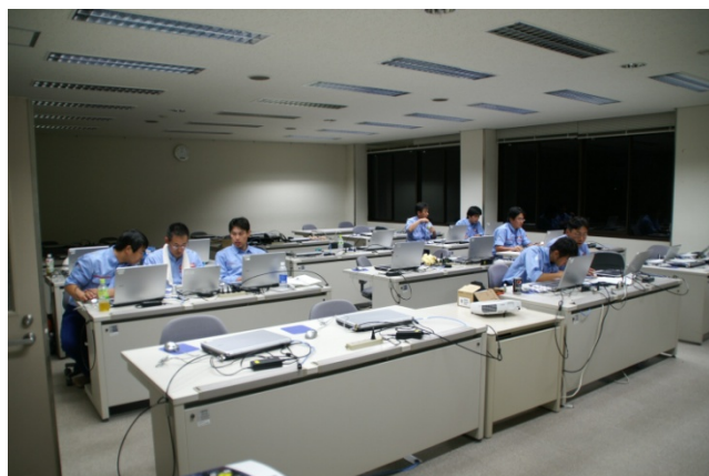
深夜に及び現場作業後のデータ整理 (九州技術事務所)