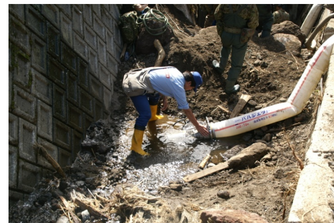
排水ポンプの目視点検