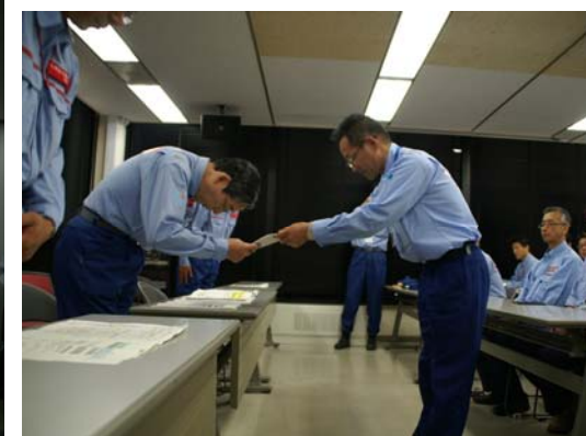
九州地整局長への報告書提出